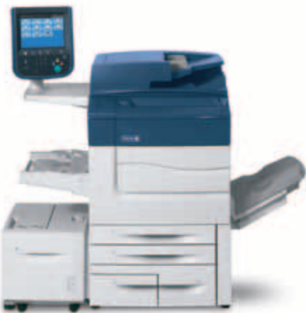
Xerox® C60/C70 ilustrat cu dispozitivul de alimentare de mare capacitate.