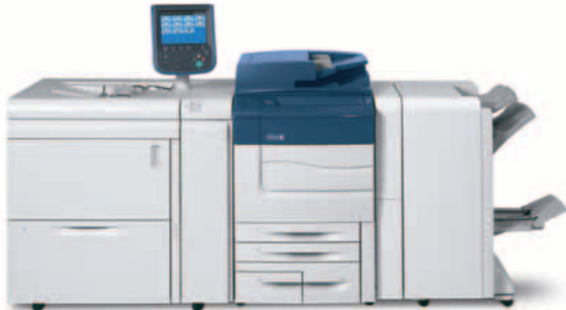
Xerox® C60/C70 ilustrat cu dispozitivul de alimentare de mare capacitate supradimensionat, cu o tavă și modulul de finisare BR cu dispozitiv de broșurare.