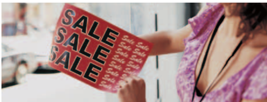
Afișe pentru vitrină imprimate pe Xerox® NeverTear

Tonerul nostru special EA cu punct de topire scăzut aderă perfect pe suprafețele din poliester prin intermediul unei metode patentate de creare a unei legături chimice, ce asigură calitatea superioară a imaginii pe tipuri speciale de suporturi, precum poliesterul etc. Premium NeverTear, pe care se poate imprima cu tonerul nostru EA, este rezistent la apă, ulei, grăsime și rupere.