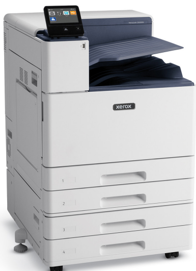
VersaLink® C8000W plus modul cu două tăvi