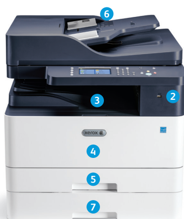
Imprimanta multifuncțională Xerox® B1025 Configurația DADF ilustrată cu tavă suplimentară opțională.