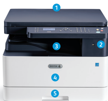
Imprimanta multifuncțională Xerox® B1022

9 Xerox® B1025 dispune de o interfață cu ecran senzorial color de 4,3 inch pentru un plus de simplitate.