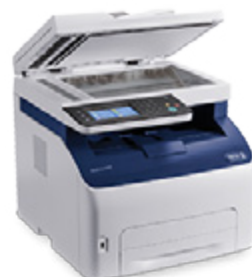
Xerox WorkCentre 6027