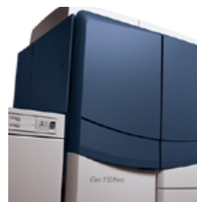
Xerox iGen 150