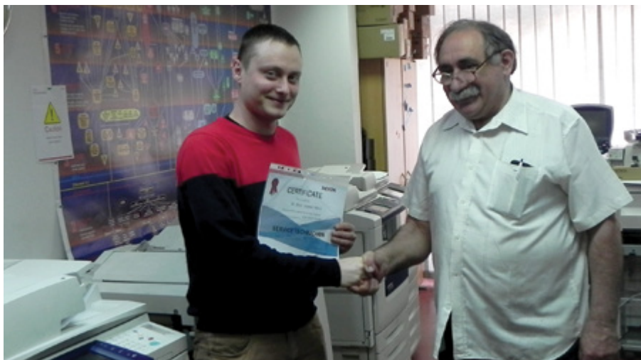
Îmbunătățirea constantă a competențelor inginerilor noștri este o preocupare importantă a Roxer Grup

Flota de autovehicule din dotarea Roxer Grup garantează acoperirea rapidă a zonelor adiacente sediilor din Cluj-Napoca și Oradea, intervențiile se efectuează zilnic în județele Cluj, Bihor, Bistrița-Năsăud, Sălaj, Maramureș, Satu Mare.