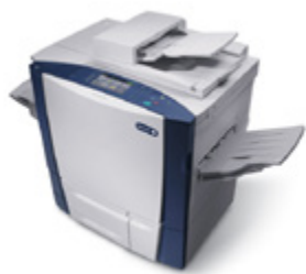
Xerox ColorQube 9302/9303

Xerox ColorQube 9302/9303 – imprimare color la preț de alb-negru