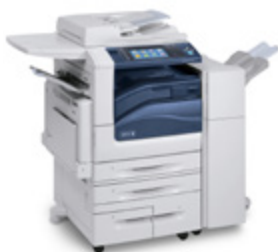
Xerox WorkCentre 7970

Color: Xerox WorkCentre 7220/7225, Xerox WorkCentre 7830/7835/7845/7855, Xerox WorkCentre 7970