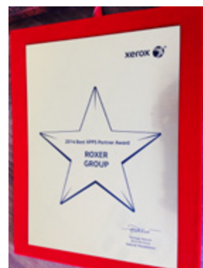
2014 Best XPPS Partner Award