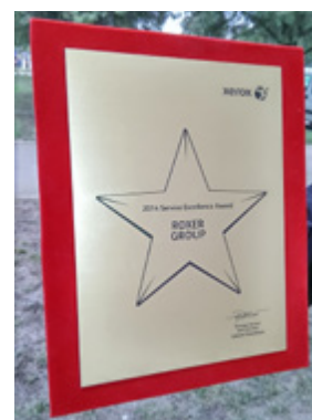
2014 Service Excellence Award