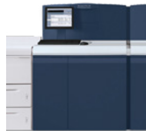
Xerox Nuvera 314

Caracteristici (selecție): viteze de imprimare de până la 150ppm (până la 8,250 coli A4 /oră), rezoluție de imprimare de până la 2400x2400 dpi, calibrare automată a echipamentelor, greutatea hârtie de până la 350 gr/mp, dimensiunea maximă hârtie 364x660 mm.