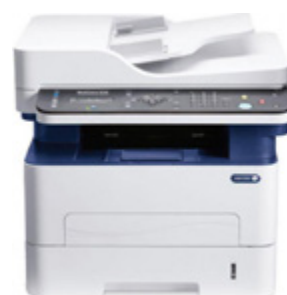
Xerox WorkCentre 3225

Caracteristici (selecție): Viteze de imprimare de până la 90 ppm, Volume lunare de imprimare recomandate între 15,000 și 100,000 pagini, procesor 1GB, memorie până la 2GB, HDD 250GB, alimentare